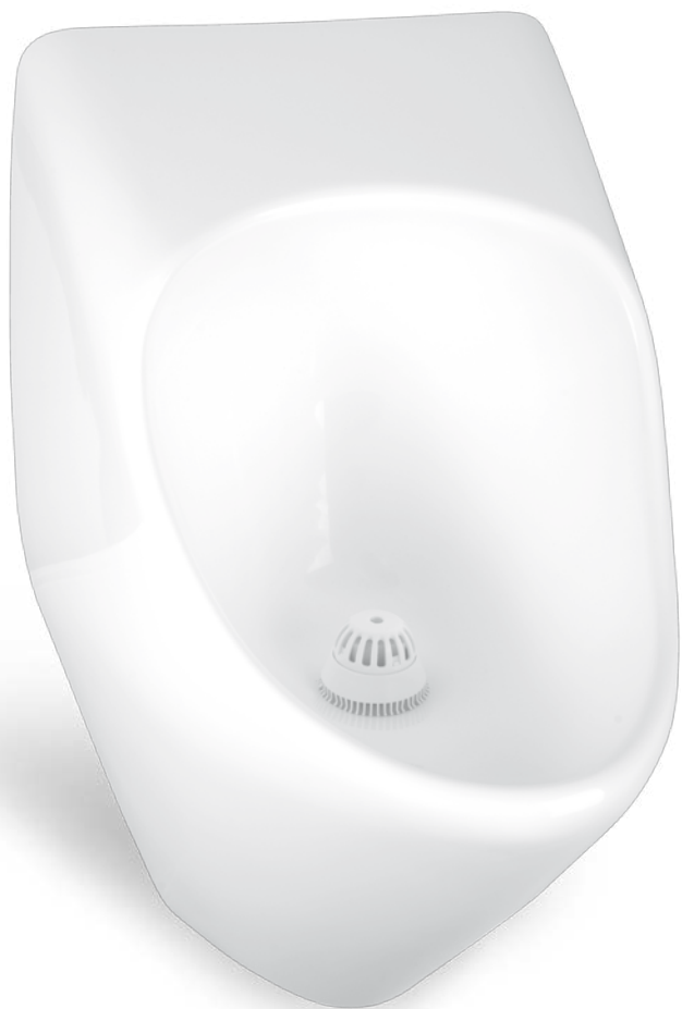
Bezvodý pisoár P8 Sklolaminát