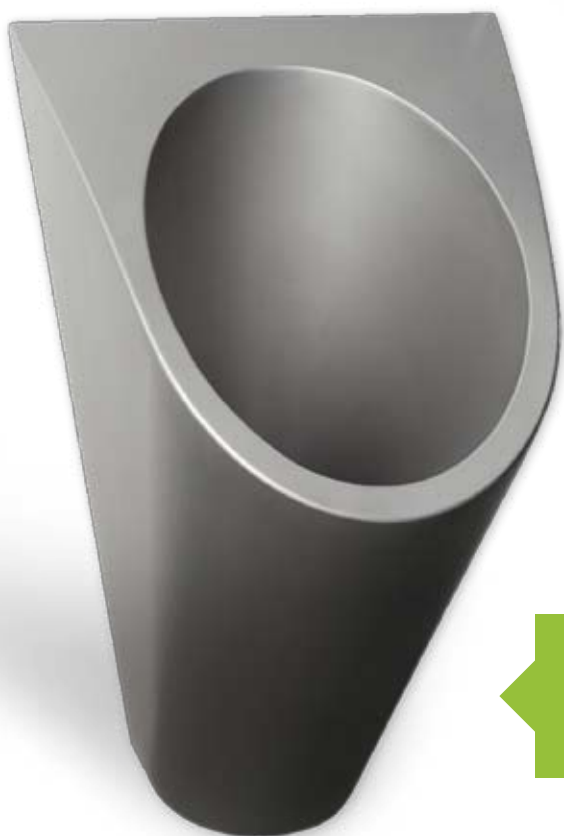
Bezvodý pisoár P3 Nerez