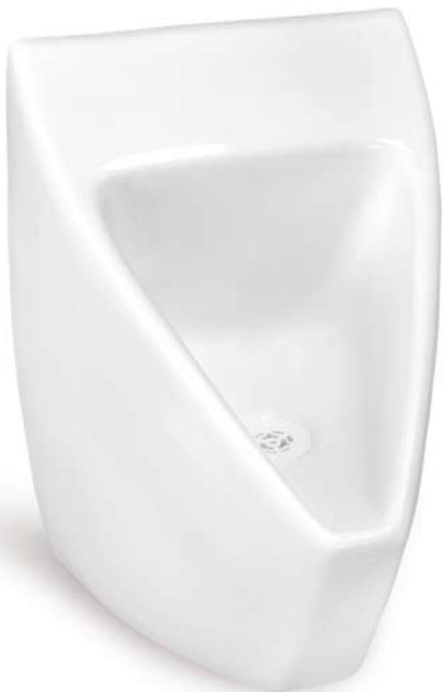
Bezvodý pisoár P1 Keramika